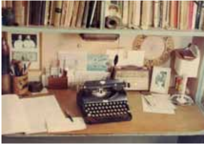
Su máquina de escribir de la casa de San Telmo. De la Muestra Haroldo Conti. Como un león. (Comisión Provincial por la Memoria. 2006).

La literatura y el periodismo son actividades que requieren de un fuerte y sostenido entrenamiento. Tanto se trate de ver el mundo a través de un personaje inventado o de disparar el click de una instantánea en plena guerra, literatura y periodismo exigen precisión, agilidad y determinación. Decididos a captar la realidad (o la fantasía), los escritores deben abrirse a los acontecimientos y a sus protagonistas con la más sofisticada de las máquinas: su propia percepción sensorial. La más lujosa de las cámaras no puede sustituir el trabajo de selección, búsqueda e intuición del ojo o el oído humano. Además de una fuerte dosis de curiosidad, es importante una disposición placentera para dejarse llevar y perderse. La presa (una pelea callejera, un delito, un abrazo furtivo) puede estar donde menos la esperamos.