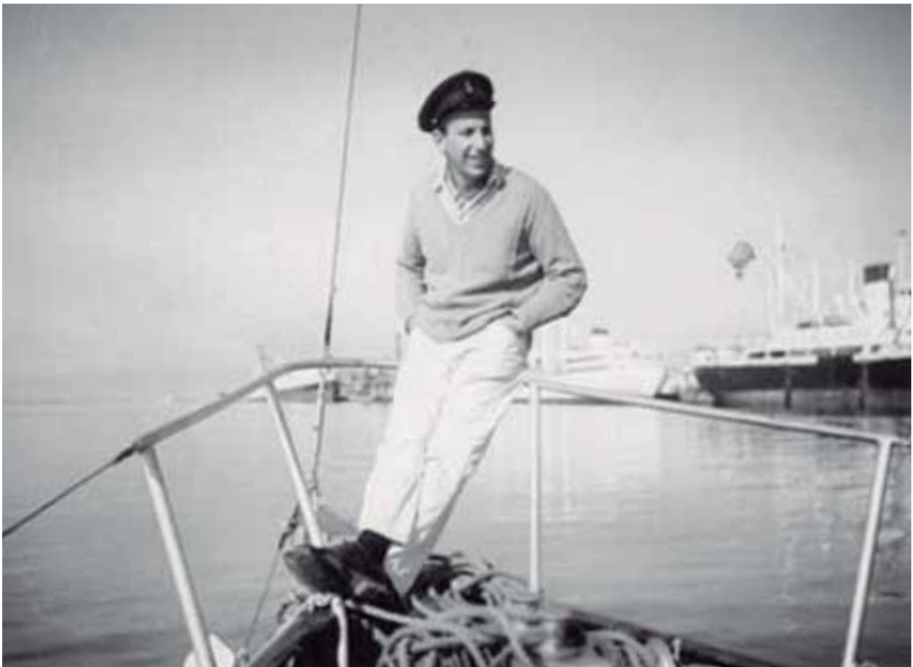
“En el río”. De la Muestra Haroldo Conti. Como un león. (Comisión Provincial por la Memoria. 2006).

Quisimos, de alguna manera, reproducir una cartografía de la lectura que es, por naturaleza, un mapa para seguir y olvidar y transitar, así, algunos textos y algunos fragmentos de la vida de Conti. Nos ampara la inagotabilidad de ambos y la necesidad compartida de que se haga justicia con la palabra de Conti. Es decir, que más y más lectores la conozcan, la disfruten y respondan con voces propias. La intención es, entonces, que estos recursos sirvan no como seguros corredores, sino como señales precarias que colaboren con los más o menos aleatorios, personales y colectivos de roteros que la lectura sigue en los complejos escenarios de las escuelas.